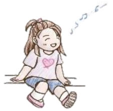
ほっとファミリーキャラクター あいちゃん