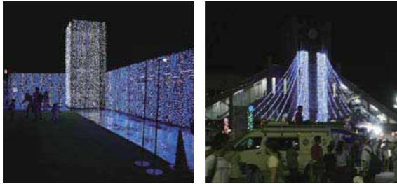
▲昨年のイルミネーションの様子

テーマ「彩」に合わせたカラフルなイルミネーションをお楽しみください。 点灯時間 7月20日(金)～27日(金)の午後7時～11時 ※28日(土)・29日(日)はイベントに合わせて点灯を行います。 会場 羽村駅東口ロータリー、西口駅前特設会場