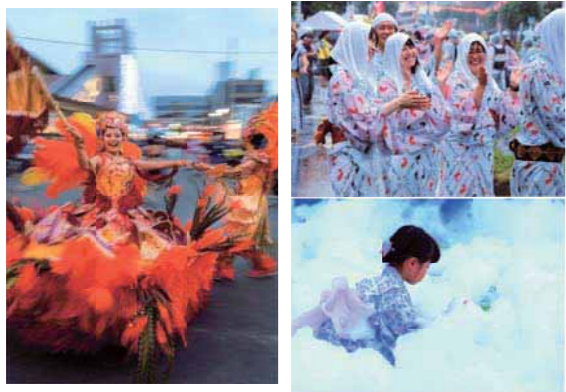
▲昨年の主な入賞作品

はむら夏まつりで撮影した写真のコンクールを行います。ぜひ、応募してください。 規格 キャビネ版(130mm×180mm)～四つ切り(254mm×305mm)で現像して提出 応募先・問合せ 会場内案内所にある応募用紙に記入し、8月17日(金)正午までに郵送または直接羽村市商業協同組合へ〒205-0014 羽村市羽東 1-1-8 ☎555-5421