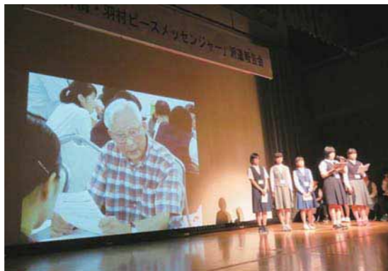
▲昨年の「青梅・羽村ピースメッセ」派遣報告会の様子

羽村ピースメッセ「ジャー」として広島市を訪問し、平和記念式典への参加、平和関連施設の見学、原爆被爆者などの体験談を通じて考えたことを報告します。 時間 午後1時30分〜2時30分 会場 ゆとろぎ小ホール 定員 200人