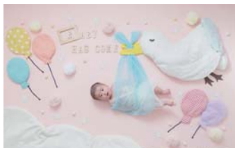
▲おひるねアートを撮影!