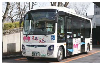
▲コミュニティバス「はむらん」