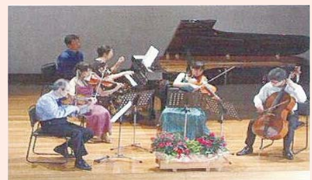
▲ N響メンバーによる室内楽