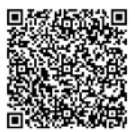
▲電子申請サービス QRコード

一時保育 対象：1歳6か月～未就学児/定員：4人(先着順)/費用：700円/申込み：9月7日(金)までに、直接ゆとろぎ窓口へ 申込み・問合せ 8月1日(水)～31日(金)の午前9時から午後8時までに、電話または直接ゆとろぎ ☎57010707 (月曜日を除く) ※電子申請サービスでも受け付けます。