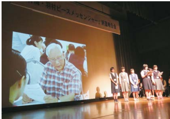
▲昨年の「青梅・羽村ピースメッセンジャー」派遣報告会の様子