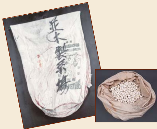
▲製糸場で使われていた油単。右はまゆを入れた状態