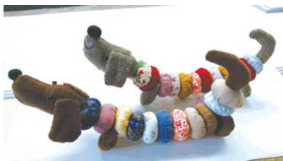
▲布で作ったダックスフント

「布で作るダックスフント」の講習会に参加しませんか。 日 8月22日(水)午前9時30分～午後3時 ※昼食を持参してください。 会 シルバー人材センター研修室 定 15人(先着順) 費 1,000円 申 8月17日(金)までに、電話でシルバー人材センターへ ☎ 554-5131