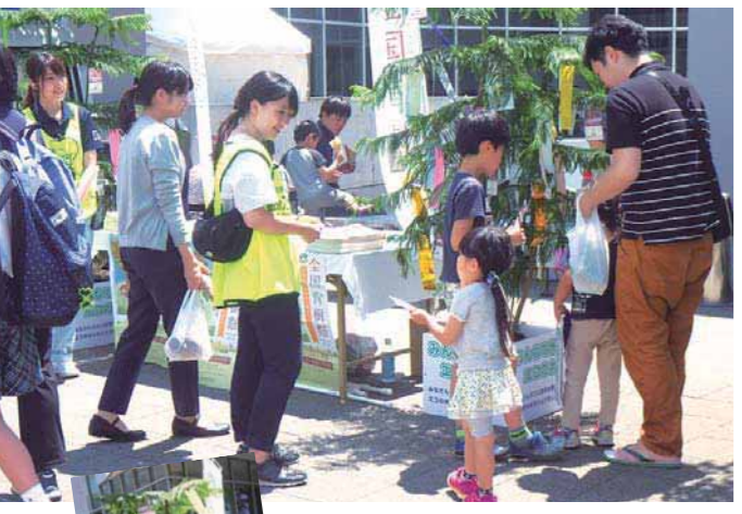
▲エコ宣言がたくさん集まりました!

クール 10代以下〜20代の若い人たちにたくさん参加してもらえたんだ。 エコ 私も学校の友達を誘って行きました。もちろん、ちゃんとエコ宣言も