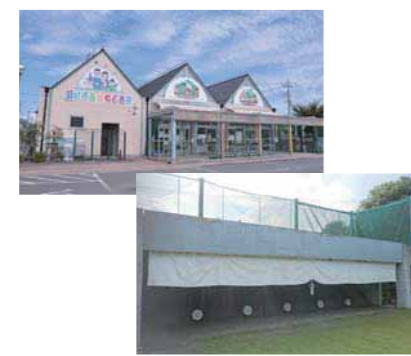
▲(左)農産物直売所(右)弓道場