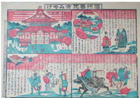
▲善光寺のお土産の絵図(大正7年)

り、どこへ旅をしたのかを探ります。 日時 9月15日(土)～12月23日(日)の午前9時～午後5時 会場 郷土博物館企画展コーナー・オリエンテーションホール・学習室 ※祝日を除く月曜日は休館日です。 問合せ 郷土博物館 ☎558-2561