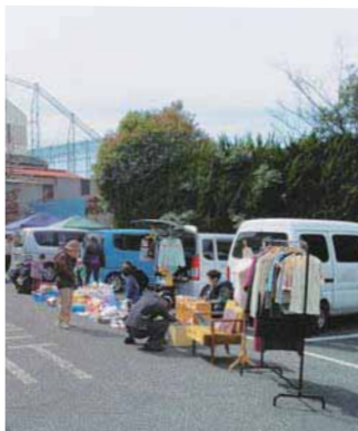
▲にじいろフリーマーケットの様子

家庭で眠っている生活用品、衣類などのフリーマーケットです。青空市の要素を取り入れ、新たなフリーマーケットとしてスタート。自動車だけではなく、自転車やキャリバッグでの出店もできます。掘り出し物を見つけたチャンスです。リサイクル社会の推進のためにもぜひ、お越しください。 日時 9月9日(日)午前9時～午後0時30分(悪天候の場合は中止) 会場 産業福祉センター駐車場 問合せ 生活環境課 ☎205