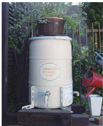
▲雨水タンクを作りましょう！

雨水タンクは、降った雨を溜めておくための設備です。溜めた雨水は庭の水やりに活用できるほか、災害時には飲み水やトイレの水にも使用すること