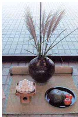
▲昨年のお月見かざり