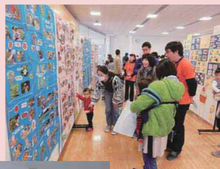
▲はむら保育園見学の様子

市外に住んでいて、子育てしやすい環境への引っ越しを考えている家族や友達に、ぜひお知らせください。