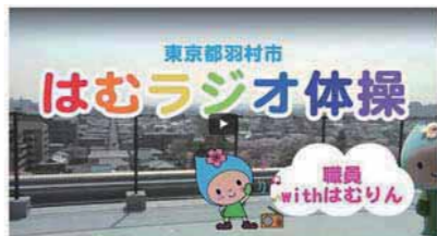
▲はむラジオ体操をご覧ください！

このプロジェクトの一ツとして、東京都公式動画チャンネル「東京動画」でラジオ体操動画を配信しています。