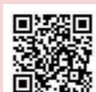
▲応募フォームQRコード