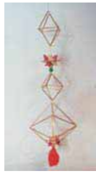
▲フィンランドの冬至祭の装飾「ヒンメリ」

「ヒンメリ」はフィンランドの田舎で生まれたと言われ、冬至祭の装飾品として人々の祈りを込めて作られていました。クリスマス室内装飾としてもおすすめです。