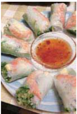
▲ベトナム風生春巻き

ベトナム南部の家庭料理(ベトナム風お好み焼き、生春巻き)を作ります。皆さんで楽しく料理をしましょう。