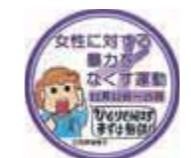
▲女性に対する暴力をなくす運動ロゴマーク（内閣府）