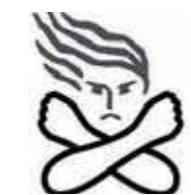
▲女性に対する暴力根絶のためのシンボルマーク（内閣府）

問合せ 企画政策課 ⑨ 366 ※今回の広報はむら18ページで「女性の人権ホットライン」について紹介しています。