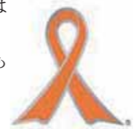
▲児童虐待防止のシンボル・オレンジリボン