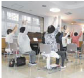
▲前回の体操の様子