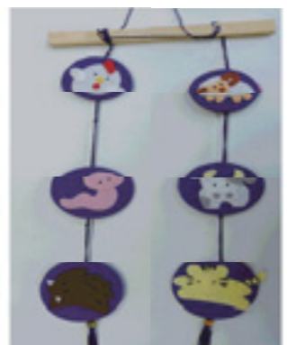
▲十二支のつるし飾りを作しましょう！

日 2月25日(月)午前9時30分～午後3時 会 シルバー人材センター研修室 定 15人(先着順) 費 1,200円 持 裁縫道具(持っている方)、昼食 申・問 2月15日(金)までに、電話でシルバー人材センターへ ☎ 554-5131