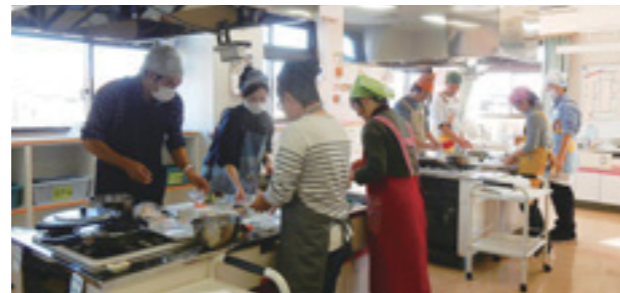
▲料理にチャレンジするパパたち

会場では、親子で元気に遊ぶ様子や、一生懸命料理にチャレンジするパパたちの姿が見られました。試食では、苦手な野菜をたくさん食べることができたお子さんもいて、笑顔があふれる講座となりました。