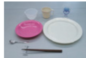
▲リユース食器の例

この事業は、（公財）東京町村自治調査会のオール東京62市区町村共同事業「みどり東京・温暖化防止プロジェクト」の助成金により、羽村市地球温暖化対策推進協議会「コネットはむらが企画運営するものです。」