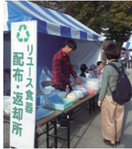
▲イベントでリユース食器を活用している様子

種類 どんぶり、おわん、皿、コップ、箸、スプーンなど ※詳しくは市公式サイトをご覧ください。お問い合わせください。