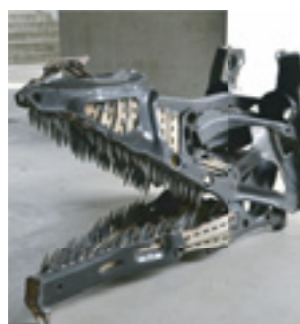
▲Velociraptor Hed 【辻蔵人作(2013年)】