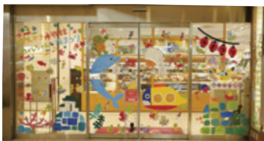
▲おえかき水族館の例