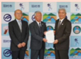
▲市長に答申が提出されました