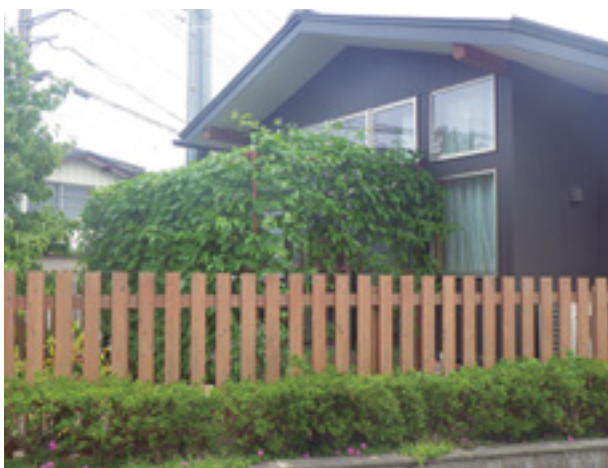
▲事業者の部 ・最優秀賞・・・まつぼっくり保育園

★今年もグリーンカーテンコンテストを行います。詳しくは、広報はむら5月15日号または羽村市公式サイトで確認してください。皆さんも、グリーンカーテンで夏を涼しく過ごしましょう。