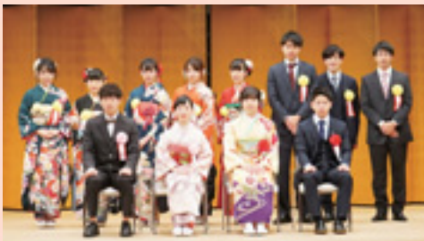
▲昨年のスタッフの皆さん

申込み・問合せ 7月5日(金)までに、電話・Eメールまたは直接生涯学習総務課生涯学習推進係⑨363へ ✉s703000@city.hamura.tokyo.jp