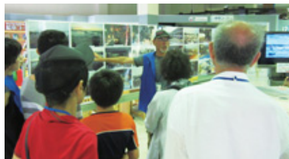
▲昨年を見学会の様子