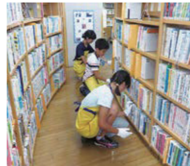
▲本棚の整理も大切な仕事