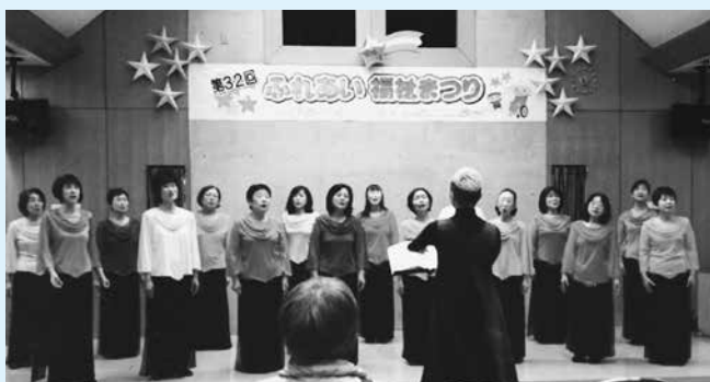
ふれあい福祉まつりの様子

歌の好きなお母さんたちが集まって活動を始め、早43年が経ちました。毎年、羽村市文化祭への参加や東京都合唱連盟主催のおかあさんコーラス大会に出場するほか、長年、老人ホームへの慰問も行ってきました。また、ふれあい福祉まつりでは、歌謡曲などの親しみやすい曲を歌い、皆さんに楽しんでいただいています。今年の7月6日には、サマーコンサートを開催し、大いに盛り上がりました。