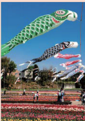
▲最優秀賞「快晴に泳ぐ」