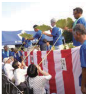
▲大賀ハスの茎からお酒などを飲む「観蓮会」

7月下旬〜8月上旬、市内唯一の水田「根がらみ前水田」では、大賀ハスが大輪の花を咲かせます。今年も、大賀ハスを育てている羽村市農業後継者クラブが、観蓮会を行います。長生きすると言いつゆえのある茎からお酒を飲む「観蓮会」や、葉蓋(大賀ハスの葉の蓋)のお点前による野点を行います。 羽村市農業後継者クラブの会員が育てた新鮮野菜の直売も行います。 日時 8月3日(土) ※小雨決行 ▼荷葉杯・野菜直売: 午前6時30分〜7時30分 ▼野点: 午前6時30分〜8時 ※野点は1回100円