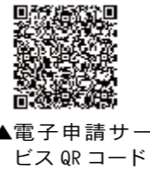
▲電子申請サービスQRコード