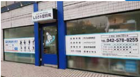
しらさわ整骨院 白澤 亮氏 (羽村市五ノ神4-12-6)