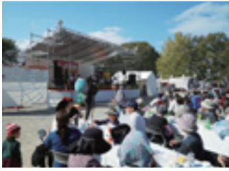
▲たくさんの人でにぎわった 今年の産業祭の様子