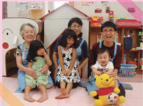
私たちと一緒に「子育て応援隊」になりましょう！