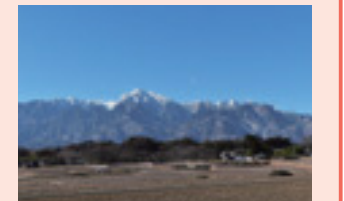
▲コースから眺める美しい 甲斐駒ヶ岳