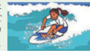
▲よりダイナミックに

古くから親しまれていたロングボードに比べ、ショートボードはターンしやすく波を急角度で駆け上がるなど縦の動きも可能となり、三次元のダイナミックな技ができるようになりました。