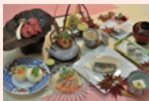
▲見た目も味も楽しめる会席料理

自然休暇村開設30周年記念の会席料理をベースに特別な一品を加えた夕食と、朝食付きで1泊大人1人6,600