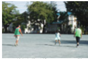
▲子どもと遊ぶボランティアの様子

子どもたちの自主的な放課後の活動をサポートする放課後子ども教室「はむらっ子広場」の支援ボランティア