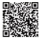
▲ LINE 相談 QR コード

相談日時 月～金曜日の午前 9 時～午後 9 時、 土・日曜日、祝日の午前 9 時 ～午後 5 時