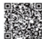
▲「愛情はむら写真展」QRコード

「東京で子育てしやすいまち」羽村市の家族の笑顔や風景など、すてきな写真を見て参加できる写真展にぜひお越しください。 日時 2月6日(木)〜16日(月)の午前9時〜午後5時(最終日のみ午後2時まで) 会場 ゆとろぎ1階展示室 ※詳しくは「愛情はむら写真展」で検索してください。