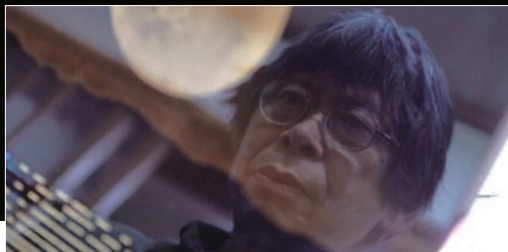
▲表面は磨きこまれて鏡のよう。厳しい目で出来栄をチェックする。