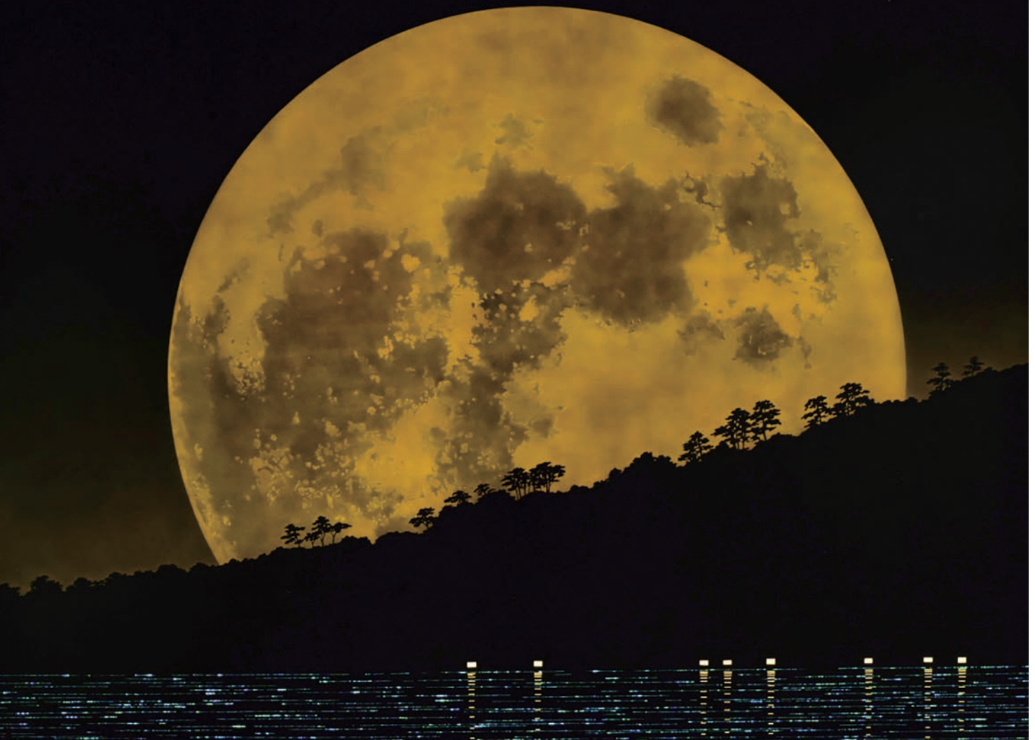
▲日本芸術院賞受賞作の「月出ずる」 80号 (112 cm× 145 cm) の大作

有名な石川県輪島出身の友達に誘われて、輪島塗りの工房で40日間お世話になりました。学校で習うのとは違って、朝は広い工房の雑巾がけで始まるんです。この工房での40日間の体験がなければ今はないわけです。