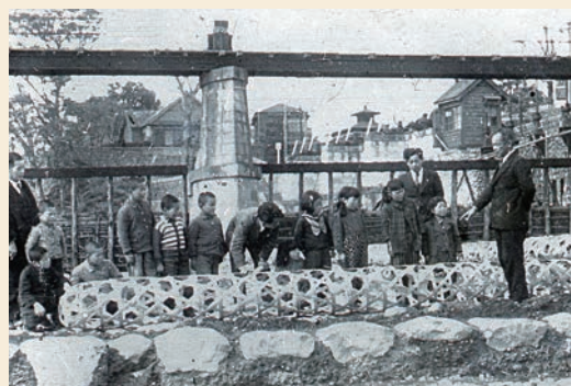
▲本来は中に石を詰めて使いますが、写真では空。説明用の見本のようです。