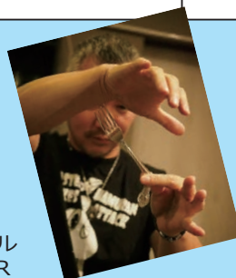
▲マスター☆ハムラン