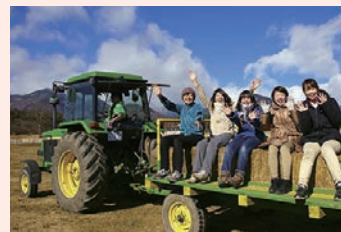
▲ヘイライドを楽しむ参加者

期間 3月29日(日)までの土・日曜日、祝日の①午前11時30分～②午後1時30分～(約15分間) 費用 1人500円(未就学児無料) 問合せ (公財) キープ協会清泉寮 ☎ 0551-48-2114