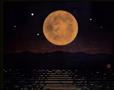
▶草花丘陵と多摩川を思わせる「月昇」