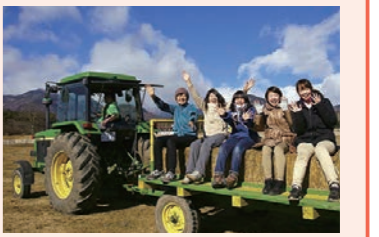
▲ヘイライドを楽しむ参加者

周辺情報 ヘイライド トラクターの荷台に積んだ牧草に腰かけてドライブしませんか。