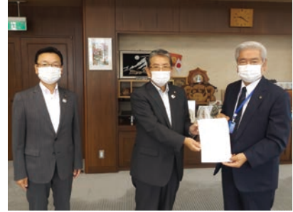
▲左から中嶋副議長、橋本議長、並木市長