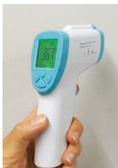
▲非接触式体温計 (イメージ)