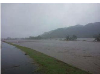
▲昨年の台風19号で増水した多摩川の様子