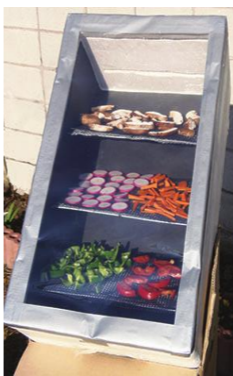
▲ソーラードライヤー

日時 3月14日(土)午後1時30分～4時 会場 ゆとりぎ3階創作室1 対象 市内在住・在勤の方優先、家族での参加可(小学生以上) 定員 15人(先着順) 費用 1500円(材料費など) 持ち物 水筒、筆記用具