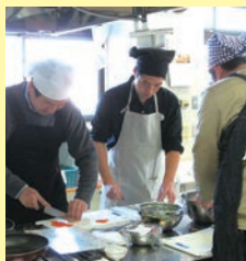
▲子育て講座で料理に挑戦するお父さん

ホップの会が紹介する親子遊びと、お父さんの手作り料理を楽しむ講座です。年1回、開催しています。開催時期が近くなったら広報はむらなどでお知らせします。