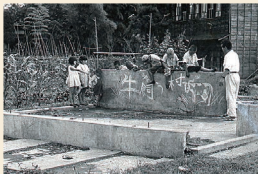
▲明治以降の村のあゆみを紹介する「開けゆく村」というスライドの中の1枚。