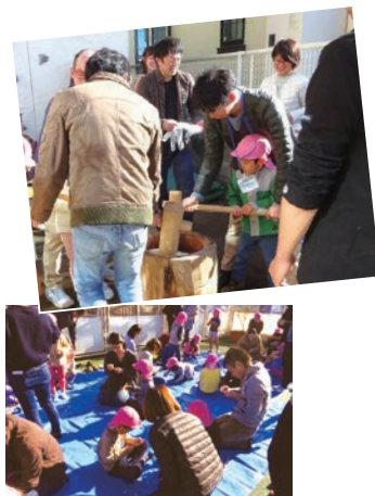
▲最近では保育園行事にお父さんの参加が増えています

A 子どもをほめる時は保護者みんなまでほめて良いのですが、叱る時には役割分担して、誰かが子どもを受け入れる態勢を取ってください。みんなからいろいろな言われると、子どもは居場所がなくなってしまう。一人が叱ったらもう一人は受け入れる、そのことには触れないで遊んであげたりすると良いですね。