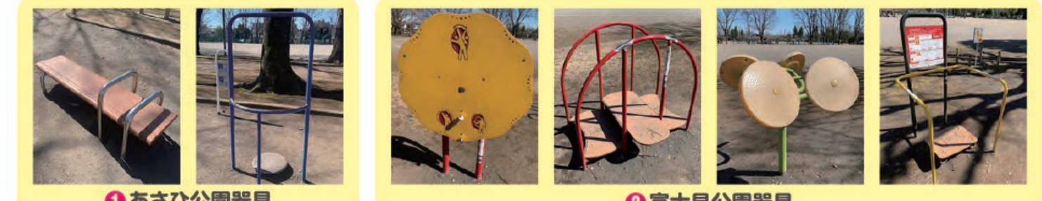
1 あさひ公園器具 2 富士見公園器具

「健康器具」は、筋肉トレーニングやストレッチなど日常生活での健康づくりを主な目的として設置されている遊具です。ウォーキングの合間にぜひ活用し、より健康な身体を目指しましょう。