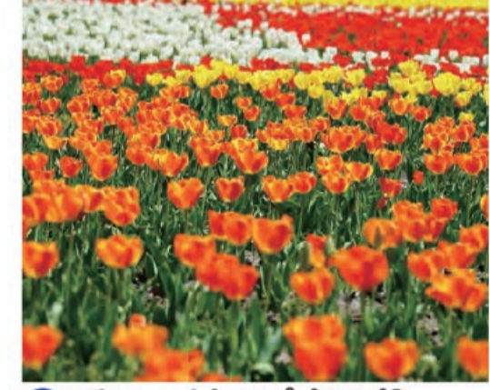
3 チューリップまつり