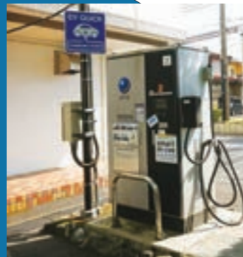
◀電気自動車用急速充電器(市役所駐車場)