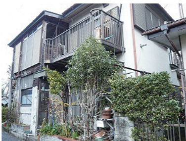
▲不動産物件(玉川 土地付建物)