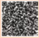
▲マイナポイントアプリダウンロード (iOS版)