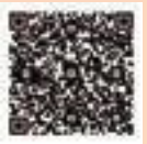
▲中小企業販路開拓支援助成金

中小企業者に対し、販路開拓に要する経費の一部を助成します。 助成額 対象経費の2分の1（本助成金を初めて利用する方は対象経費の3分の2、いずれも上限10万円）