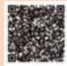
▲地域イノベーション創出事業助成金

中小企業者が単独または連携し、新製品開発などにより、新事業展開、新分野進出などを行う場合、その経費の一部を助成します（助成メニューが複数あります）。