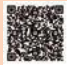
▲ICT活用販路開拓事業助成金

中小企業者がウェブサイトの作成費用のほか、在宅勤務やウェブ会議などのテレワークを推進するために必要な機器などを購入するための経費を助成します。 助成額 対象経費の10分の10（上限10万円）