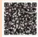
▲技術力向上及び人材育成支援助成金

中小企業者が技術力向上や人材育成にかかる講習会の受講、資格取得などに要した経費の一部を助成します。 助成額 対象経費の2分の1（上限20万円）