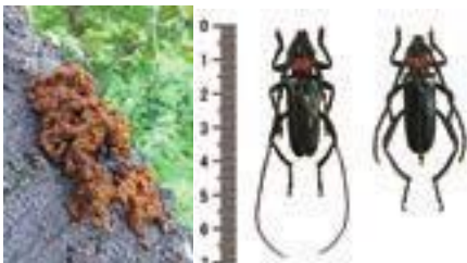
▲フラス 見つけたら環境保全課に連絡してください。