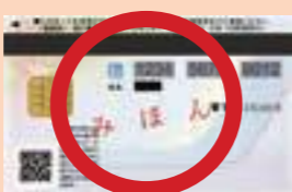
▲マイナンバーカード