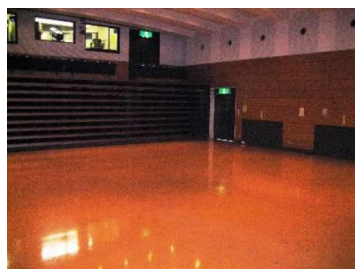
ホール（椅子収納時）