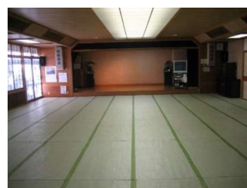
老人集会室（夜間のみ）