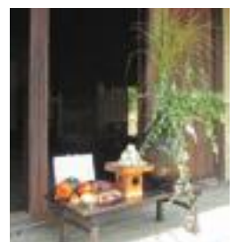
▲郷土博物館のお月見飾り