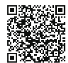
▲エコアクションポイント

特に記載がない場合の受付時間は土・日曜日、祝日、年末年始を除く午前8時30分～午後5時です。申込みの記載がない場合は直接会場へ。費用の記載がない場合は無料です。