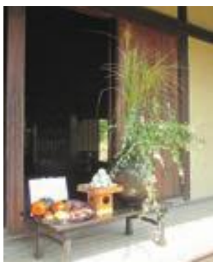
▲お月見かざりの様子