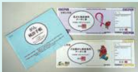
▲検診手帳、クーポン券

特に記載がない場合の受付時間は土・日曜日、祝日、年末年始を除く午前8時30分～午後5時です。申込みの記載がない場合は直接会場へ。費用の記載がない場合は無料です。