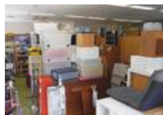
▲リサイクルセンター内部

粗大ごみの中には、椅子やテーブル、収納家具など、まだまだ使える品物がたくさんあります。