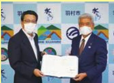
▲多摩包装工業株式会社 指田代表取締役と並木市長