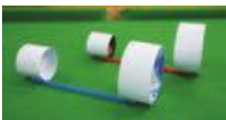
▲へんてこライダー