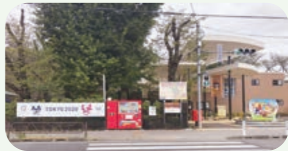
▲ミライトワとソメイティの横断幕 動物公園エントランス横に掲出しています