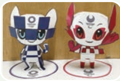
▲ミライトワ(左)とソメイティ(右)のペーパークラフト

市では、市内公共施設に東京2020マスコットを用いた横断幕やのぼり旗などを掲出して