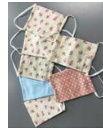
▲手作りマスクの例

感染症対策として、毎日使用するマスク。使い捨てではなく、繰り返し使えるマスクを手作りしてみませんか。お財布にも優しく、手作りの楽しさも味わえます。マスクの扱い方(洗い方)などについても話します。 日時 11月25日(水)午前10時～11時30分 会場 青梅市役所2階会議室 対象 西多摩地域在住・在勤・在学の方