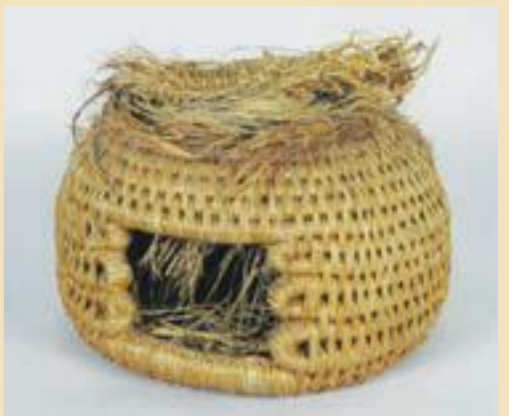
▲上のボロボロの部分は本来フタで、開くようになっています。随分激しく使われたようです。

ネコックラ(猫ちぐら)は猫用の寝床です。現在もいろいろな素材のネコックラが販売されていますが、写真は昭和20年代に使われていたワラ製のもの。ワラは保温性に優れているため、中に入ると暖かく、防寒にぴったりです。このネコックラは元はきれいなドーム形だったのを、猫がボロボロにしてしまったとのこと。