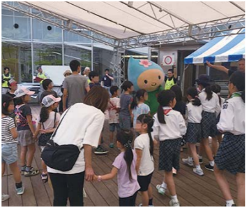
▲昨年の環境フェスティバルの様子

市では、市民や事業者などと協働して、毎年6月に「環境フェスティバル」を行っています。令和3年度に「第10回羽村市環境フェスティバル」の実行委員を募集します。