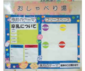
▲おしゃべり場 (掲示板)

お子さんが好きな絵本は何ですか。大人も楽しめる絵本情報なども教えてください。 毎月変わるテーマに沿って思ったことやつぶやきなどを掲示板に貼り、情報を共有しませんか。子育ての方同士つながりが感じられる「新しいおしゃべり場」を一緒に作りましょう。 日 毎月1日～15日の相談員在席曜日・時間 (中央児童館…火・木・土曜日、西児童館…月・水・金曜日、東児童館…火・金・日曜日) 対 未就学児を育てている方 問 子ども家庭支援センター 578-2882