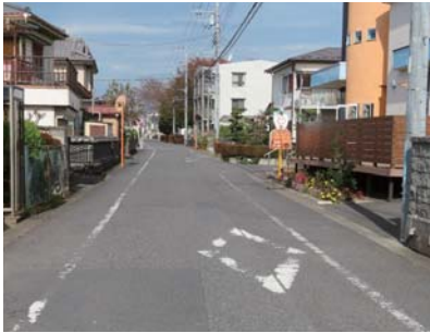
消えかかった路面標示と路側帯

行うので計画との差が生じている。今後も、市の財政状況を的確に把握し、道路補修に努めていく。