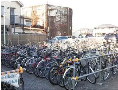
羽村駅西口の駐輪場

市長 今後の駅前周辺の整備時期を踏まえて、本町西口商店会をはじめとする関係団体を通じ、事業者や権利者の意見を聴くとともに、様々な機会を捉えて、幅広い年代の方々からの意見も聴いていく。