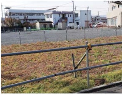
羽村駅西口に広がり利用されないままの空き地