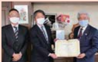
▲株式会社イチカワ 市川代表取締役社長と並木市長