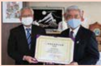
▲立川精密工業(株)大越代表取締役社長と並木市長