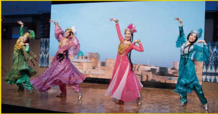
出演:ウズベキスタン ダンス アンサンブル ウズベギム