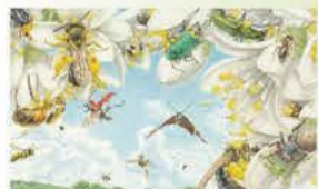
「つちはんみょう」(縦2m×横6m)