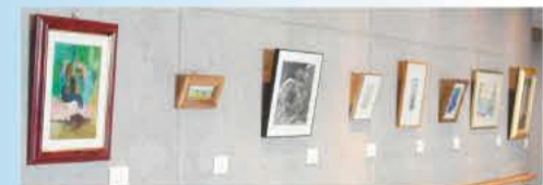
ゆとろぎ所蔵作品