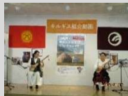
ゆとろぎで撮影をした、伝統的な木製楽器「コムズ」を演奏する様子