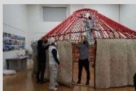
遊牧民の伝統的な移動式住居「ユルタ」の組立てワークショップの様子

キルギス共和国のホストタウンとして、今年も多くのイベントを実施する予定です。イベントに参加して、キルギスを知り、一緒にキルギスを応援しましょう。