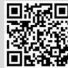
コムズ演奏などの動画はこちらからご覧いただけます。