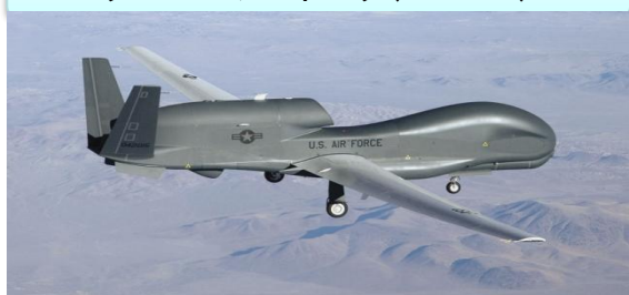
グローバル・ホーク(RQ-4)